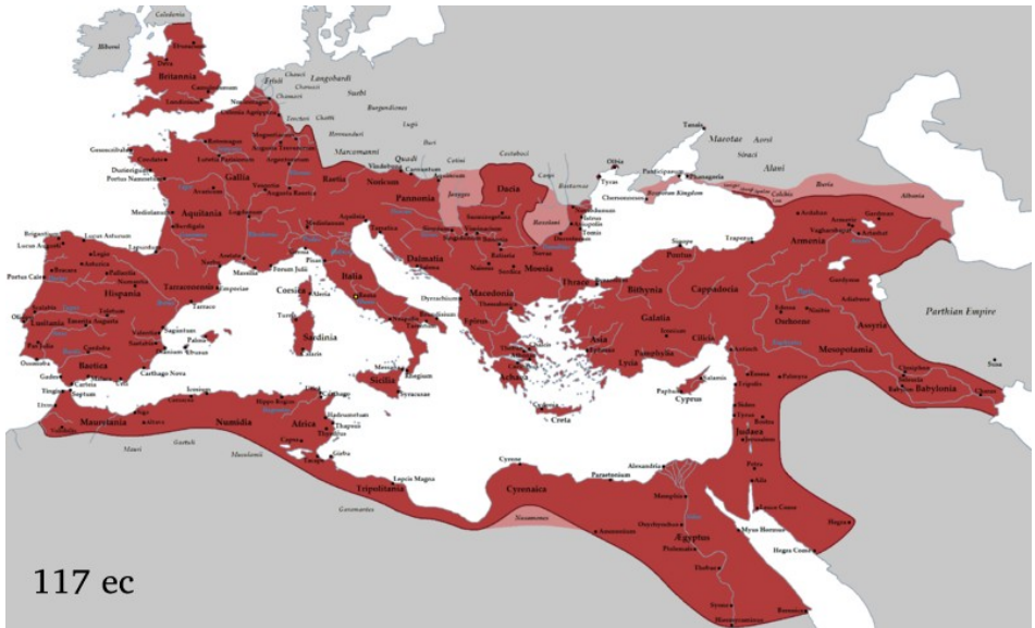
Estende masima de la Impero Roman, su la imperor Trajano en la anio 117 EC.

Sua cusin Hadriano (117–138), viajor e om de cultur, ia maneja eselente la Impero e ia crea un rede de vias militar cual ia permite ce la soldatos marxa plu rapida asta la fronteras. Sua muron ia estende tra 117 kilometres en la norde de England.