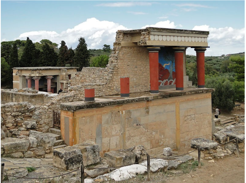
Palasio de Cnosos, de la sivilia minoan.

La orijinas de la cultur elinica es en Criti, do un cultur grande ia developa: la sivilia minoan (2500–1600 AEC). Esta sivilia ia deveni rica par sua comersia e domina de la mar. Lo ia conose scrive (sistem silabal linial A) e ia construi palasios, como lo de Cnosos.