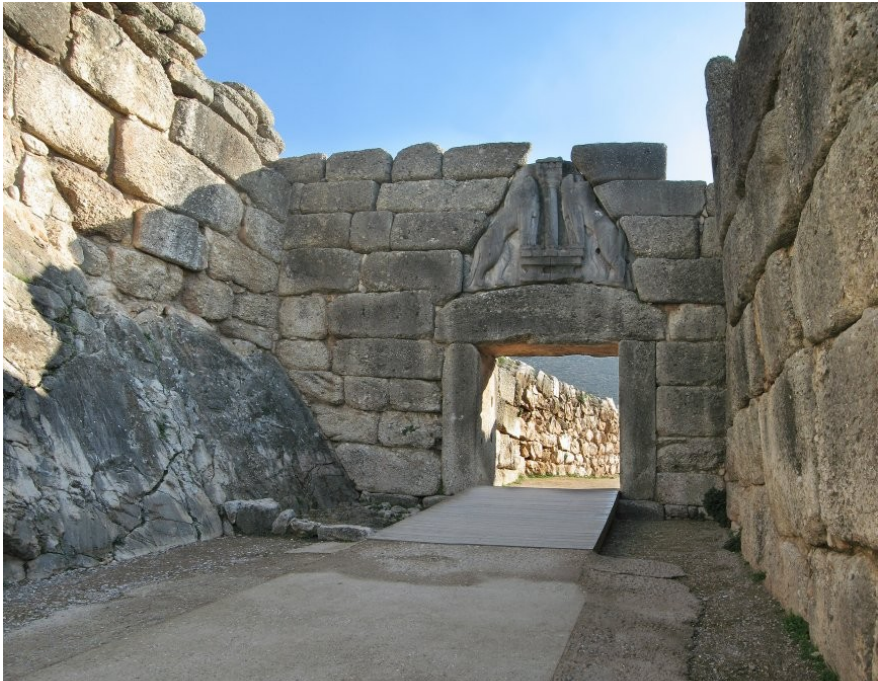
Porton de Leon en Misene, de la sivilia misenean.

Entre 1200 e 1100 AEC, la sentros misenean ia es ardeda e destruida par la invade dorian. La conose de fero ia aida los. La invade dorian ia comensa un periodo nomida la eda elinica media o la eda oscur: la usa de scrive ia desapare e la fontes de sabe ia diminui. En esta eda la aceanes ia migra a la isolas e costas de Anatolia.