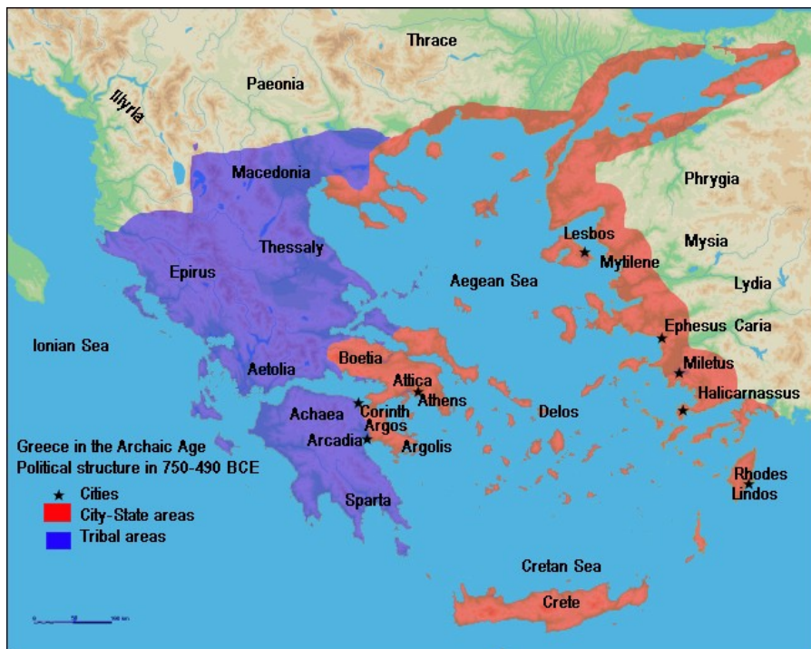
Elas en la eda anticin.

Elas es situada en la estrema sude de la penisola balcan e la penisola Peloponeso. La rejion jeografial cual la elinicas ia ocupa pote es divideda en cuatro partes: